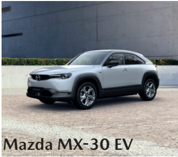
Mazda MX-30 EV