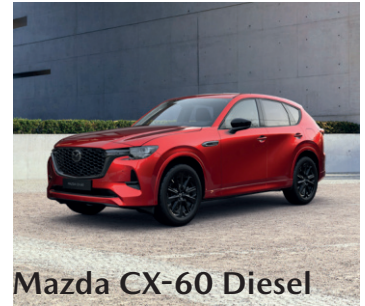
Mazda CX-60 Diesel

Energieverbrauch*: Mazda CX-60 e-Skyactiv PHEV 241 kW/327 PS: WLTP-Kraftstoffverbrauch 1,5 l/100 km; WLTP-CO 2 -Emissionen 33 g/km; WLTP-Stromver- brauch 23,0 kWh/100 km; NEFZ-Kraftstoffverbrauch 2,2 l/100 km; NEFZ-CO 2 -Emissionen 48 g/km; NEFZ-Stromverbrauch 16,0 kWh/100 km