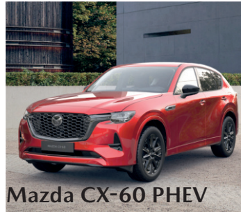
Mazda CX-60 PHEV

Energieverbrauch*: Mazda CX-30 Prime-Line e-Skyaktiv G 122 90 kW / 122 PS Benziner im kombinierten Testzyklus (WLTP): 5,9 l/100km. CO 2 -Emissionen kombiniert: 134 g/km