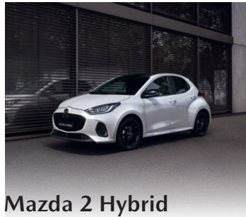
Mazda 2 Hybrid

Energieverbrauch*: Mazda2 Prime-Line Skyactiv-G 75 6GS FWD (55 kW/ 75 PS Benziner) Kraftstoffverbrauch kombiniert: 4,4 l/100 km; CO 2 -Emissionen im kombinierten Testzyklus: 101 g/km. CO 2 -Effizienzklasse: B