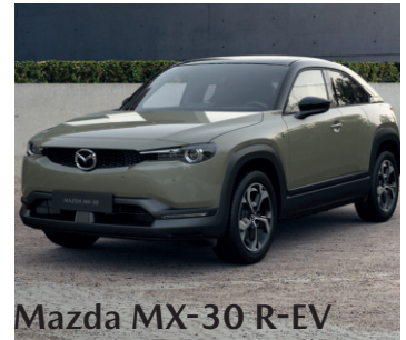
Mazda MX-30 R-EV

Energieverbrauch*: Mazda 3 e-Skyactiv G 122 mit 90 kW/122 PS; 6-Gang-Schaltgetriebe; Frontantrieb; WLTP-Kraftstoffverbrauch: 5,6-5,5 l/100 km; WLTP-CO 2 -Emission: 127-124 g/km;